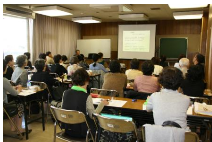
ワークショップ 「心の病と自殺～うつ病に悩む方達をどのように支えるか～」

* 2日目は4分科会と18ワークショップが行われた。(それぞれのテーマ・講師は次ページ参照)