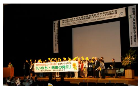
閉会式 次年度開催センター紹介