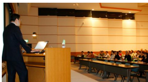
分科会「がん患者、家族、遺族の心のケア」

* 3日目の全体会では「各国の自殺予防の姿勢に学ぶ」と「各国からの紹介」が行われた。