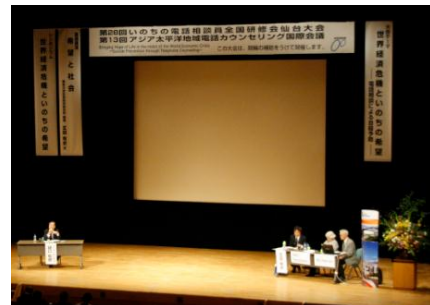
1日目 シンポジウム テーマ「世界経済危機といのちの希望」