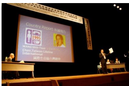
各国(韓国・台湾・日本)の自殺予防の姿勢の発表、タイ・こころの電話相談、東京英語、(関西)中国語相談室、オーストラリアからもそれぞれ報告があった。

* 3日目の全体会では「各国の自殺予防の姿勢に学ぶ」と「各国からの紹介」が行われた。